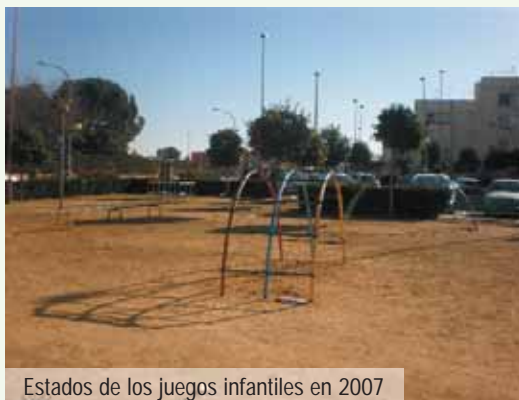
Estados de los juegos infantiles en 2007

hemos cumplido. Hemos tratado de ubicarlos en todos los lugares. Y para ello, la inversión ha alcanzado 458.066, 27 €. Mucho dinero, pero muy bien gastado al redundar en la felicidad de los niños y la tranquilidad de sus padres. Nuestra intención ahora es seguir con este esfuerzo para llegar allí donde aún faltan infraestructuras de este tipo y para mantener los ya existentes o incluso sustituir aquellos deteriorados por el uso. ◀