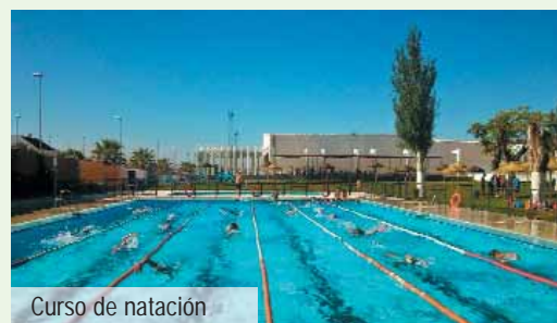
Curso de natación

■ De sobra es conocido por todos, que las instalaciones deportivas de Arahal eran muy precarias. Por culpa de ello, la práctica del deporte dejaba mucho que desear, perjudicando especialmente a los niños más jóvenes. Por eso, desde el primer momento nos pusimos a tratar de remediar la situación con grandes inversiones. Construimos en el solar de la Venta pistas de pádel, tenis, una multiuso, renovamos por completo la piscina de verano (que cuando llegamos no tenía ni depuradora y el agua se filtraba) y a falta de la pronta terminación de las obras de la piscina cubierta y su gimnasio, decidimos construir un campo de fútbol 7 de césped artificial. Nos costó 112.177,58 €, a los que hay que añadir 55.838,98 € del centro transformador y 5.555,32 € de las redes. Su puesta en marcha tuvo polémica ya que un desalmado, en plena Noche Vieja de 2013, decidió quemar una buena parte de su superficie. Sin embargo, logramos que el seguro municipal nos pagara los daños y pudimos poner también a disposición del pueblo este campo.