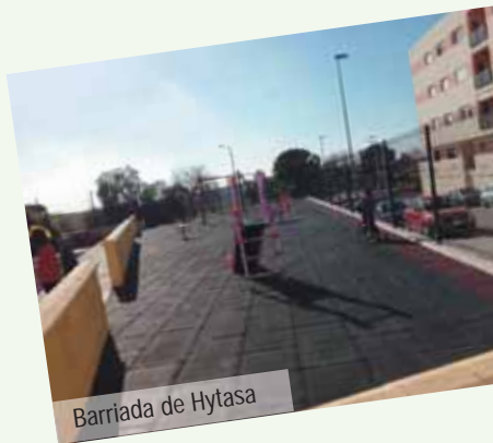
Barriada de Hytasa