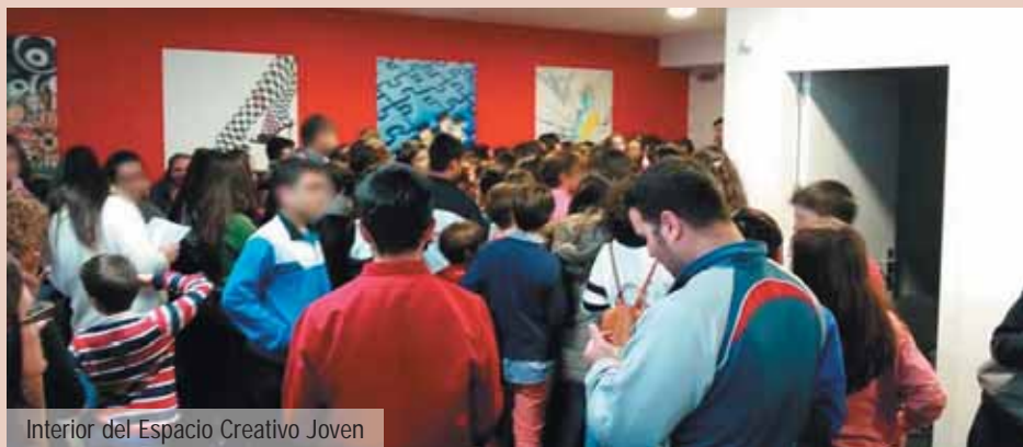
Interior del Espacio Creativo Joven

Tratamos de responder así a la preocupación de muchos padres en estos años atrás que se quejaban de que el Ayuntamiento no daba suficientes alternativas de ocio a los jóvenes. Aunque sabemos que este espacio no es suficiente para colmar todas las necesidades, al menos vamos dando pasos en la buena dirección. ◀