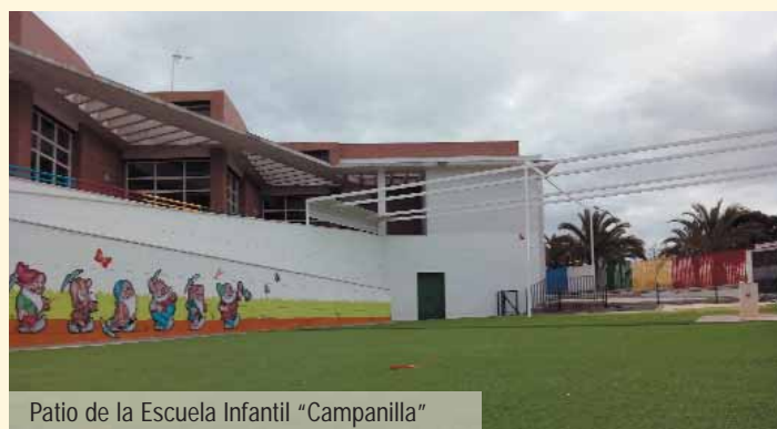
Patio de la Escuela Infantil “Campanilla”

Es un servicio que pudimos privatizar como en muchas otras localidades, pero decidimos gestionarlo directamente desde el Ayuntamiento a través de su Sociedad de Desarrollo, tal como prometimos en las elecciones. Hoy es un servicio público con unos ingresos, en 2013, de 298.574 € (el 82%, procedente de la subvención de la Junta de Andalucía y el 17% restante, procedente del pago de la tasa de los padres) y unos gastos de 293.543 €, lo que supone un pequeño superávit anual que se reinvierte en la escuela y que permite en la práctica pagar puntualmente al personal mes a mes (desde la directora hasta el personal de limpieza). Las cuentas cuadran y el servicio público es viable. ¡Sí se puede!