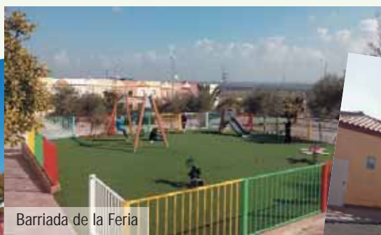
Barriada de la Feria