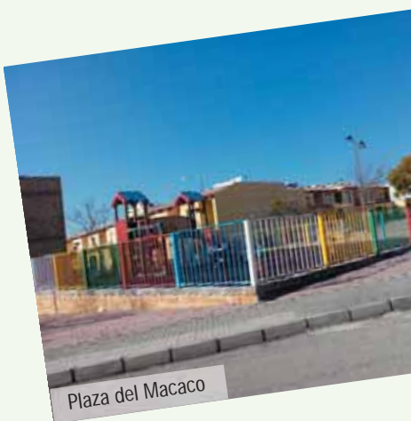
Plaza del Macaco