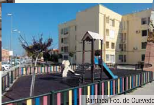
Barriada Fco. de Quevedo