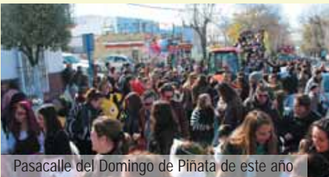
Pasacalle del Domingo de Piñata de este año

■ ■ Hemos querido fomentar la afición al Carnaval entre los más jóvenes, contando con la buena predisposición de los colegios, padres y profesores. El resultado ha sido espectacular: todos los domingos de piñata de estos últimos cuatro años, la Corredera se ha llenado de luz, color y alegría con tantos niños disfrazados, acompañados de sus padres, procedentes de sus centros escolares. Está claro, que el Carnaval cuenta con sus seguidores en nuestro pueblo y ya no se perderá... ◀