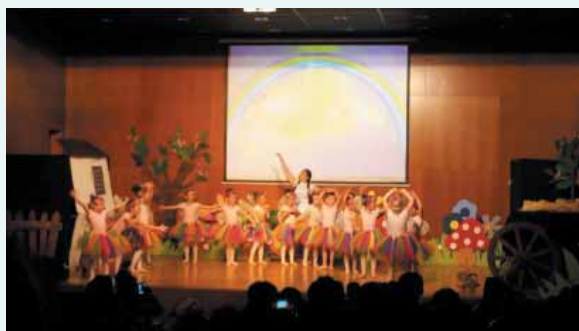
Espectáculo "El Mago de Oz", 27-06-2013