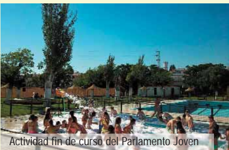
Actividad fin de curso del Parlamento Joven

■ ■ Otro ejemplo de colaboración (en este caso, los tres institutos) es el proyecto de "Parlamento Joven". Es un proyecto pedagógico y de participación dirigido a adolescentes de 1º y 2º de ESO, que pretende educarlos en los valores democráticos. Es una oportunidad para tratar con los técnicos del Ayuntamiento y sus políticos, cual concejales municipales, asuntos que les preocupan como las drogas y el alcohol, el vandalismo, la seguridad ciudadana, los espacios verdes, el deporte y el ocio. Para esto se plantea que los escolares vivan durante el curso escolar un proceso de participación sobre los asuntos de su comunidad, adquieran una visión global de su municipio y realicen propuestas para solucionar los problemas que les afectan ◀