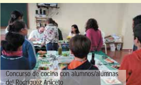
Concurso de cocina con alumnos/alumnas del Rodríguez Aniceto