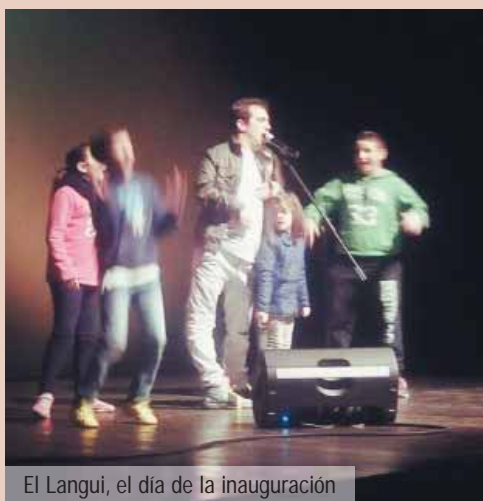
El Langui, el día de la inauguración

En aquel recinto, programamos desde actividades de ocio (como proyecciones de películas, talleres de tatuajes, campeonatos de fífta, talleres de cocina creativa, etc.) hasta cursos de formación (iniciación de monitor de tiempo libre, iniciación al inglés...), siguiendo las sugerencias de los usuarios. Los sábados ampliamos el horario hasta las 12'00 de la noche para que los jóvenes puedan tener alternativas, aquellos que quieran, a la rutina de siempre.