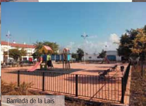
Barriada de la Lais