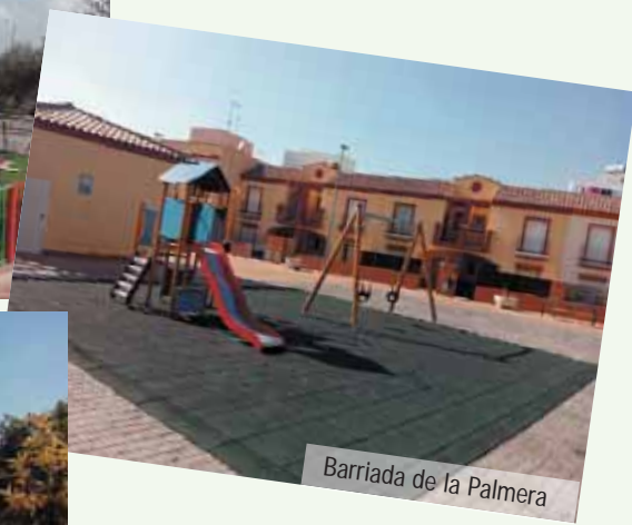
Barriada de la Palmera