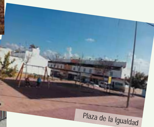
Plaza de la Igualdad