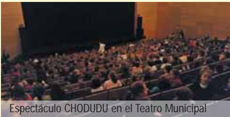
Espectáculo CHODUDU en el Teatro Municipal

■ ■ Ahora que nos hemos dotado de una muy envidiable infraestructura cultural, queremos que los más pequeños se acerquen a ella y aprendan a disfrutar de una obra de teatro o de títeres, o un concierto de música clásica o flamenco, adaptados para ellos. Es la mejor manera, desde el colegio, a enseñarles a valorar la cultura. Por eso, dedicamos, en 2014, 6.676,65 € en traer durante todo el año, compañías didácticas especializadas en el trato con los alumnos de primaria ◀