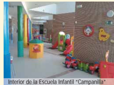
Interior de la Escuela Infantil “Campanilla”

Hubo que esperar a septiembre de 2011 para que abriera sus puertas la segunda Escuela infantil de Arahal, tras varios años de obra y varios meses de aburridos trámites administrativos para lograr la financiación de los puestos escolares de la Consejería de Educación. Desde entonces son muchos los padres que han podido matricular a sus hijos en esta dependencia (en el curso 2014/15, concretamente, 107 niños están inscritos).