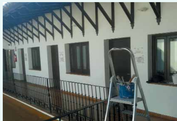
Mantenimiento del edificio de la Escuela de Música en 2015

Cuatro años después podemos afirmar con rotundidad que el acierto ha sido absoluto. Y para muestra un botón: de los 403 alumnos matriculados en el curso 2011/12 hemos pasado a 441 en la actualidad. La Escuela tiene éxito y los chavales de Arahal, la mayoría niñ@s, cada vez muestran más interés por la enseñanza de la Música. Es un servicio público que nos costó, en 2013, 181.000 € y por el cual ingresamos con las tasas municipales 90.864 €. El déficit es de 90.136 €. Pero el Ayuntamiento seguirá hasta el último suspiro manteniendo ese desfase porque nuestro saneamiento económico nos lo permite y sobre todo por el bien de nuestros niños y su formación. ◀