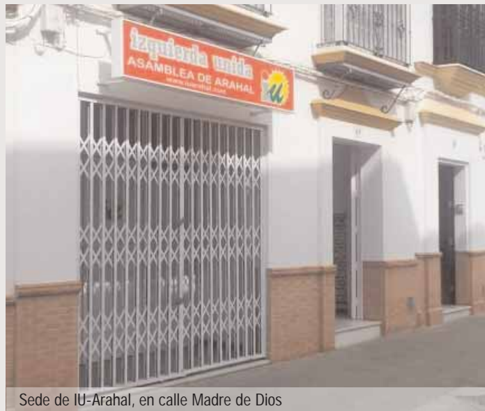
Sede de IU-Arahal, en calle Madre de Dios

IU-Arahal, en su vocación no de criticar sino de buscar soluciones y ayudar, lleva un año prestando servicio de ase-