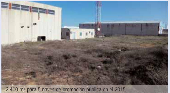
2.400 m 2 para 5 naves de promoción pública en el 2015