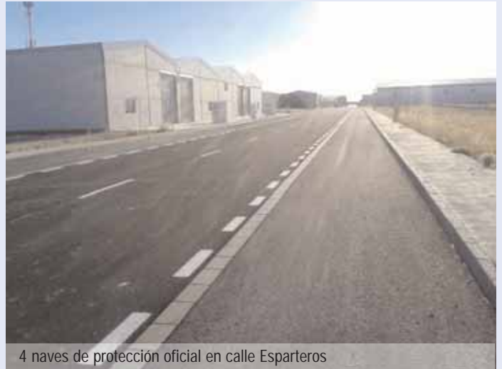
4 naves de protección oficial en calle Esparteros

Fuimos, por ejemplo, a Sevilla a la Agencia de Innovación y Desarrollo de Andalucía, dependiendo de la Comunidad andaluza, al objeto de firmar un convenio que garantizara una ayuda económica a fondo perdido a aquellos pequeños empresarios necesitados de unas instalaciones propias y adecuadas en el Polígono industrial. Logramos ese acuerdo y gracias a él no sólo hemos edificado cuatro naves en la c/ Esparteros, en "Los Pozos", con un precio final de venta de 115.307 € sino que además, hemos conseguido que los adjudicatarios perciban una subvención a fondo perdido de entre 30.000 € y 34.000 €. Y eso es lo importante de esta operación: han adquirido, con la firma de las escrituras el 22 de diciembre pasado, unas construcciones por debajo del valor de mercado. Son por ahora tres empresas (a falta de una cuarta en negociaciones con el banco) de los sectores de la construcción, la carpintería metálica y la reparación y venta de motos, las que se ven beneficiadas de esta gestión. Nos alegramos por ellas ◀