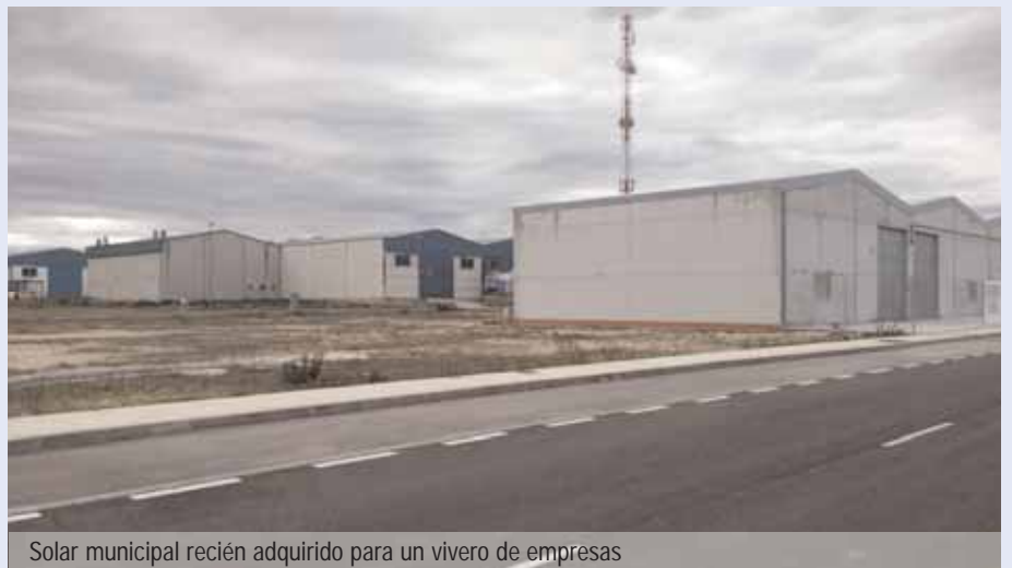
Solar municipal recién adquirido para un vivero de empresas

■ ■ En otra ocasión, tuvimos que irnos a Madrid para convencer a la Fundación Incyde de nuestra voluntad sería de ingresar en una red de 96 viveros empresariales repartidos por España, con la finalidad de desarrollar dos proyectos empresariales innovadores para nuestro pueblo, contando con la experiencia de la mencionada Fundación y la Cámara de Comercio de Sevilla. Para mostrarles nuestra seriedad, compramos el pasado 28 de julio de 2014 una parcela de 431 m 2 en la c/ Esparteros, 39 del Polígono industrial por valor de 50.919,36 € con el proyecto de construir una nave de 359 m 2 con dos módulos y una entreplanta de 100 m 2 para dos oficinas y una sala de juntas. La idea es asignar gratuitamente por unos años, los dos módulos a dos pymes locales de nueva creación. Los gastos de ejecución de esa obra ascienden a 194.084 €. No lo hubiéramos podido afrontar por nosotros mismos, pero este proyecto será una realidad a finales de 2015 ya que la Fundación Incyde nos va a financiar el 80% de la inversión (160.067,20 €), asumiendo el resto el Ayuntamiento, (40.016,80 €). Actualmente, se está redactando el proyecto de ejecución para proceder a la adjudicación de las obras en primavera. Nuestro profundo convencimiento de que el Ayuntamiento debe adquirir patrimonio público de suelo, nos ha permitido no perder la oportunidad, como tantas veces en nuestra historia reciente, de conseguir esta magnífica subvención con cargo a fondos FEDER europeos ◀