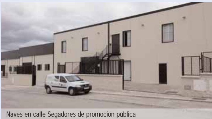
Naves en calle Segadores de promoción pública

empresas. En su día, el 19 de mayo de 2004, se cedió esa propiedad municipal de 4.000 m 2 a la Fundación Red Andaluza de Economía Social, que ahora se llama Andalucía Emprende, vinculada a la Consejería de Economía, Innovación, Ciencia y Empleo, con la finalidad de establecer una escuela de empresas en dos fases: una con dos naves y unas instalaciones administrativas (existentes en la actualidad) y otra, con otras dos naves que nunca llegaron a edificarse. Como sabemos que la Junta de Andalucía no las va a construir por sus problemas financieros, hemos negociado con ella para lograr la restitución de los terrenos abandonados (2.400 m 2 ). La petición formal se logró presentar el 28 de noviembre de 2013 y el pasado 24 de junio de 2014 nos comunicaban que nos los devolvían. Tardaron siete meses, pero ya se sabe... las cosas de palacio van despacio. En cuanto el Registro de Fundaciones autorice la reversión, inscribiremos la parcela en el Registro de la propiedad a nombre del Ayuntamiento con la idea de construir, en 2015, no dos como estaba previsto desde 2004, sino cinco naves de 400 m 2 cada una para venderlas a emprendedores locales a precio de costo, sin gravar el precio final con ningún beneficio empresarial. ¡Sí se puede! ¡Claro que se puede! ◀